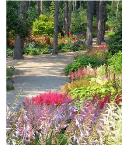
Parc Floral