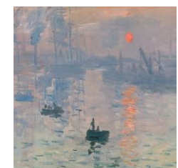
Claude Monet Musée Marmottan Paris

Contacter Isabelle O'LEARY pour réserver : 06 09 40 92 06